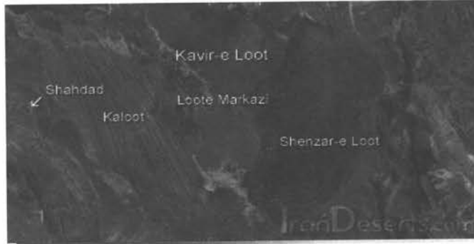
شکل (۱) - تصویر ماهواره ای کویر لوت