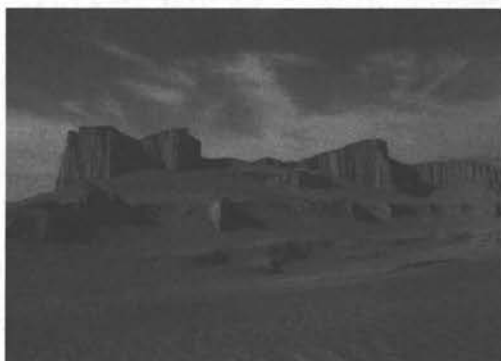
شکل (۳) - کلوت شهداد - منبع: www.NGDIR.IR