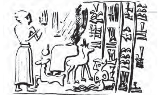
تصویر ۱۱- اثر مهر استوانه‌ای، مکشوفه از شوش، ماخذ: (Ibid)

نمونه دیگری از نقش زن- ماهی در اثر مهوری وجود