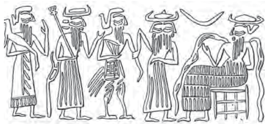
تصویر ۲- اثر مهر استوانه‌ای اکدی، وزیر دوچهره: ایسمود، پرنده انسانی را به حضور آ می آورد، ماخذ: بلک و گرین، ۱۸۳، ۱۲۸۲