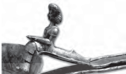
تصویر ۱۵ الف- پیکره زن، ماهی از نمای نزدیک تر، (همان)