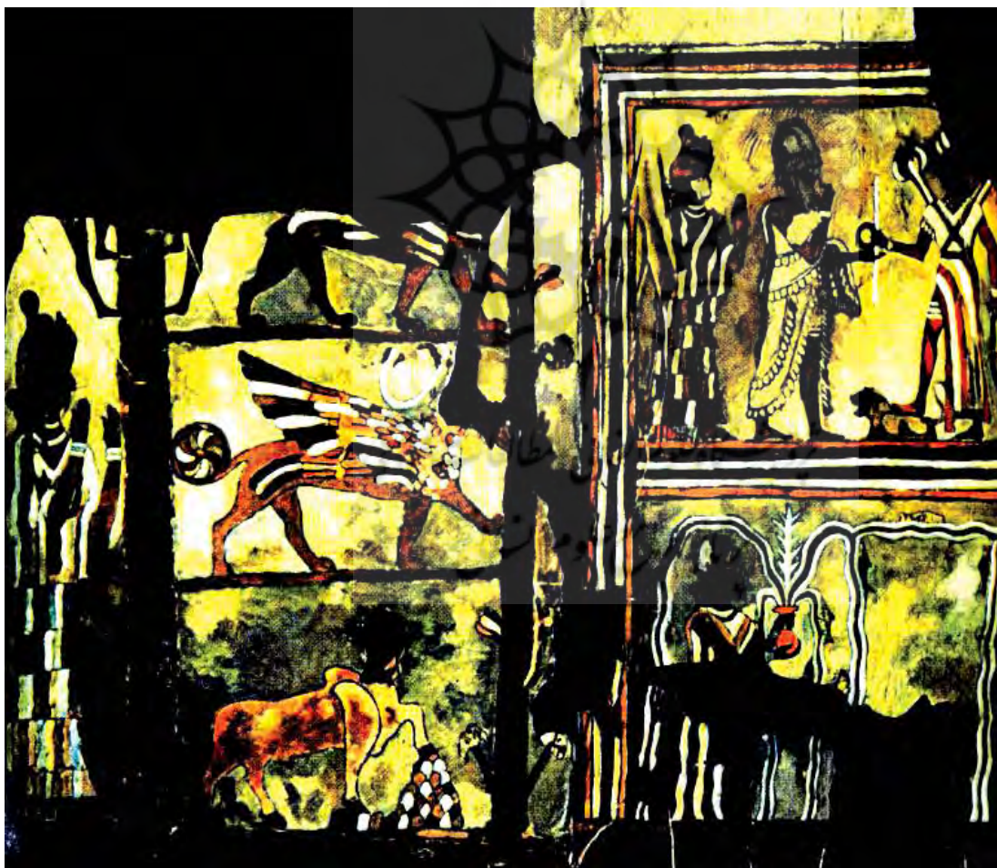
بخشی از نقاشی دیواری کاخ زیمریلیم؛ حکمران ماری، دوران بابل قدیم، تصویر الهه‌ای با گلدانی در دست که رشته‌های آب از درون آن به اطراف فوران کرده‌اند، در گوشه سمت راست دیده می‌شود. (مجیزاده، ۱۳۸۰)