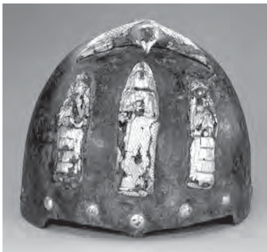
تصویر ۸- کلاه خود، سده چهاردهم ق.م، دوره ایلام میانی، جنوب غربی ایران، موزه متروپولیتن، ماخذ: www.Metmuseum.org