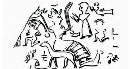
تصویر ۱۲- اثر مهر استوانه‌ای مکشوفه از شوش، Ibid

بر مذهب ایلامی اندک بود. در برابر، شوش در زمینه اصول و معتقدات مذهبی با اور (اریدو)؛ شهر مقدس آ-خدای آب‌ها و حکمت- رابطه نزدیکی برقرار کرده بود، نمونه‌های متعددی از این ارتباط مانند: تصاویر افسانه‌ای نیمه گوزن- نیمه ماهی یا نیمه انسان- نیمه ماهی را می‌توان در نقوش برجسته و مهرها مشاهده کرد». (مجیدزاده، ۱۳۷۱، ۵۷)