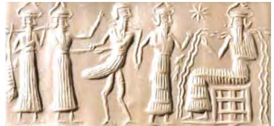
تصویر ۱- اثر مهر استوانه‌ای اکدی، ۲۲۰۰-۲۳۰۰ ق.م. بین‌النهرین،