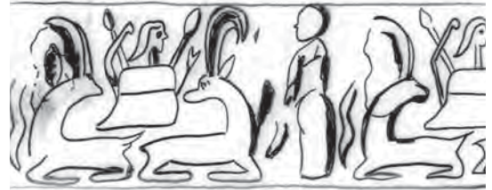
تصویر ۱۸- اثر مَهر استوانه‌ای، شهاد، ماخذ: Hakemi, 1997, 661

را در این مَهر به نمایش گذاشته است» (حاکمی، ۱۳۸۵، ۱۵۱) وجود ایزدبانوان آب که البته با توجه به شرایط آب و هوایی این منطقه کاملاً طبیعی به نظر می‌رسد، در ایلام و بر روی آثار ایلامی هم سابقه داشته است. این موضوع نشان دهنده این است که وجود آب در هر دو منطقه اهمیت داشته و متوسل شدن به خدایان آب برای ازدیاد این نعمت، امری بدیهی بوده است.