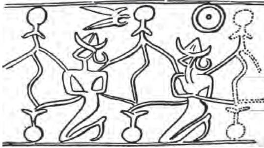
تصویر ۶- اثر مهر استوانه‌ای با نقش خدایان آب، دوران ایلام میانی، چغازنبیل، موزه ایران باستان، ماخذ: پرادا، ۱۳۸۵، ۴۷