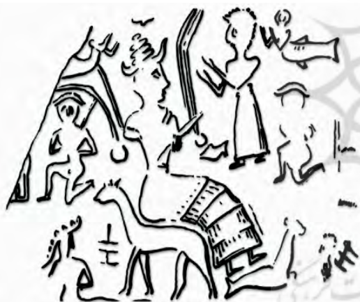
تصویر ۱۶- اثر مُهر استوانه‌ای، مکشوفه از شوش، در این جا یک زن-ماهی در گوشه سمت راست (بالا) و یک بز-ماهی در زیر پاهای خدای بر تخت نشسته دیده می‌شود، ماخذ: Amiet, 1972