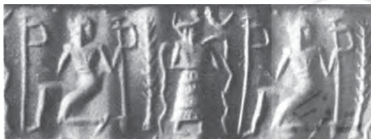
تصویر ۱۰- مهر استوانه‌ای، مکشوفه از شوش، ماخذ: Ibid

گرفت و او را به عشق مرد جوانی از مردم شهر گرفتار کرد، با این که نزدیکی یک الهه با موجودی فناپذیر، مایه سرافکنندگی اوست، درستو خودداری نتوانست و با آن جوان ازدواج کرد و از این پیوند، دختر به وجود آمد ....» (گریمال، ۱۳۸۷: ۱۲۷)