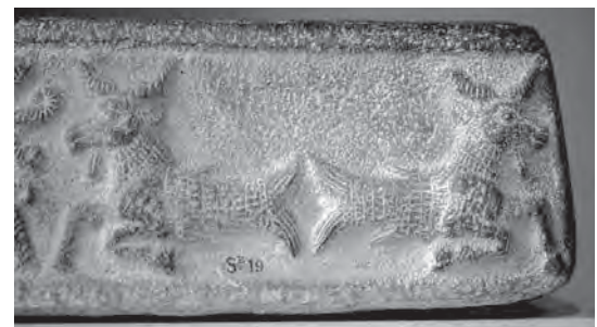
تصویر ۱۳- بخشی از حوض آئینی که موجوداتی با سر بز کوهی و دم ماهی را نمایش می‌دهد، سنگ آهک، دوره ایلام میانی (۱۱۰۰-۱۵۰۰ ق.م)، شوش،

با توجه به آن چه گفته شد می‌توان نتیجه گرفت نقشمایه موجودات ترکیبی نیمه انسان- نیمه ماهی از بین‌النهرین وارد ایلام شده بود. ولی همان طور که پیش از این هم بیان شد، ایلامیان مقلدان صرف هنر بین‌النهرین نبودند، بلکه ذوق و خلاقیت آن‌ها چنان در این امر دخیل می‌شد که از محصول وارداتی تنها به عنوان یک ماده استفاده می‌کردند و شکل و رنگی بومی به آن می‌بخشیدند. یکی از خلاقانه‌ترین موجوداتی که به همین شکل در ایلام شکل گرفت؛ زن- ماهی است. بر اساس مجسمه‌ای که از این موجود به دست آمده؛ پیر آمیة