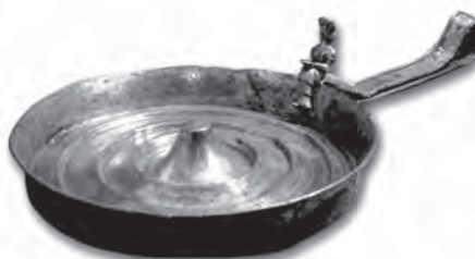
تصویر ۱۵- ظرف آیینی با پیکره زن-ماهی، جو بَی، رامهرمز، دوره ایلام نو (۵۳۹-۵۵۸ ق.م)