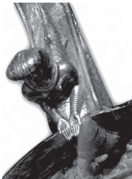
تصویر ۱۵ ب- پیکره زن-ماهی از بالا، (همان)