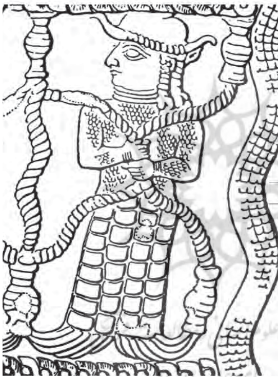
تصویر ۷- الهه آب، قسمتی از لوحه سنگی اونتاش‌گال، ۱۳۰۰ ق.م. شوش، ماخذ: پرادا، ۲۵۳۵، ۸۱

مهر که سالم مانده، مشاهده کرد. مشابه اثر قبلی، خدا بر چهارپایی نشسته و پاهایش را بر روی یک بز- ماهی گذاشته، اما این جا در برابر او، دو نفر که یکی از آن‌ها ایستاده و دستانش را احتمالاً به نشانه‌ی تضرع بالا برده و دیگری که بریک پا زانو زده؛ قرار گرفته‌اند. الهه آب‌ها نیز در پایین صحنه و در بخش زیرین محل قرارگیری خدا جا گرفته است. (تصویر ۱۲)