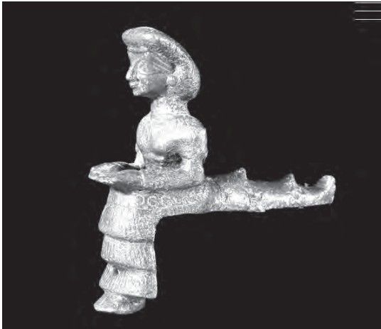
تصویر ۱۴- پیکره زن- ماهی. دوره ایلام میانی، ۱۲۰۰-۱۴۵۰ ق.م. جنوب غربی ایران، نزدیک تنگ سروک،

می گوید بخشی از یک صندلی بوده که البته این موضوع را وجود سوراخ‌هایی برای پرچ کردن میخ‌ها تایید می‌کنند. این الهه برنزی را مانند سایر خدایان بر تخت نشسته ساخته‌اند و جالب این که از پشت با یک زاویه نود درجه به بدن یک ماهی وصل شده است. (تصویر ۱۴)