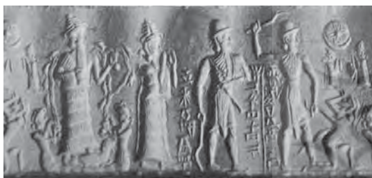
تصویر ۹- مهر استوانه‌ای مکشوفه از شوش، ماخذ: Amiet, ۱۹۷۲